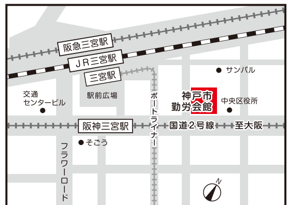
神戸市勤労会館へのアクセス

JR元町西口・阪神元町駅より北へ徒歩7分 地下鉄県庁前駅 東1・2出入口 下車すぐ