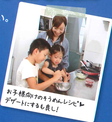
お子様向けのそうめんレシピ♪ デザートにするもよし!