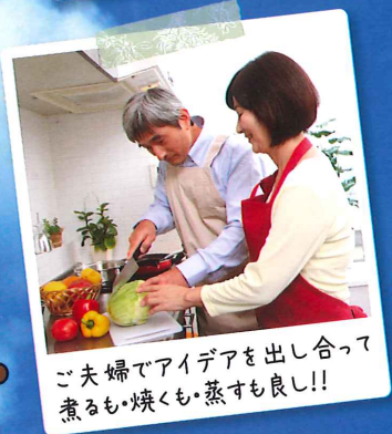
ご夫婦でアイデアを出し合っ て煮るも・焼くも・蒸すもよし!!