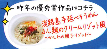
★ 昨年の優秀賞作品はこちら