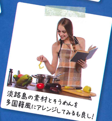
淡路島の素材とそうめんを 多国籍風にアレンジしてみるもよし!