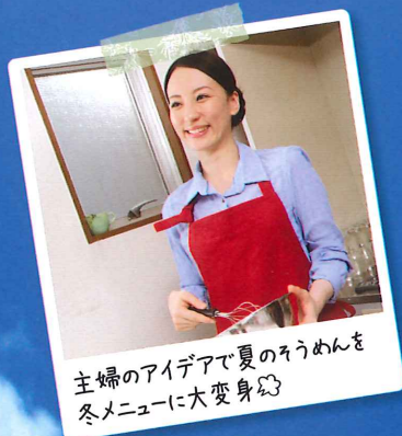
主婦のアイデアで夏のそうめんを 冬メニューに大変身☆