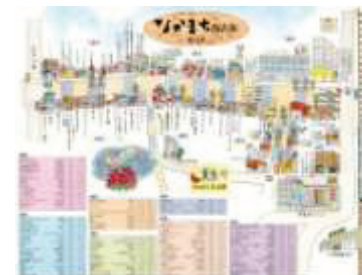
商店街マップ作成