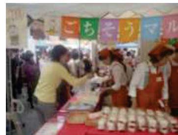
被災地物産展の開催

地域住民が安心して生活できる環境を維持している商店街が再生に向けた意欲的な取組を行う場合に継続的に支援を実施する。