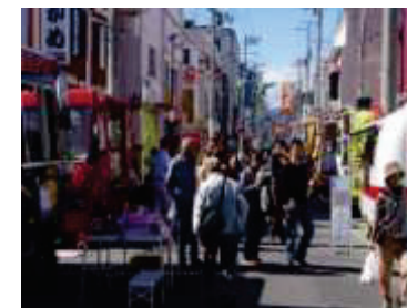
商店街の継続的な活性化が期待できるイベント開催