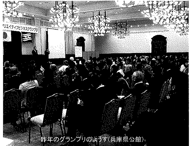
昨年のグランプリのようす(兵庫県公館)

懇親交流会 17:30～19:30 グランプリ終了後、会費制(1,500円)の懇親交流会を行います。 どなたでも参加できます。この機会にネットワークを広げましょう。