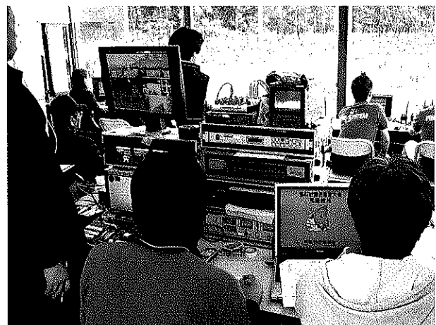
株式会社ファインシステムのスポーツ計測のようす