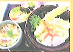
海鮮 Curryうどん ¥1,365