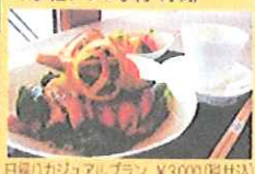
日帰りカジュアルプラン ¥3,000(税込)