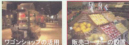
ワゴンショップの活用