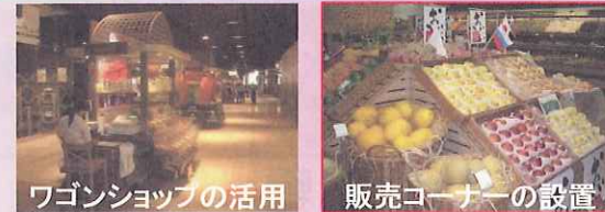
ワゴンショップの活用