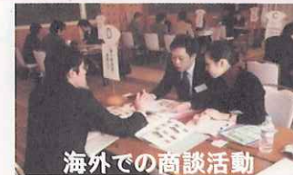
海外での商談活動