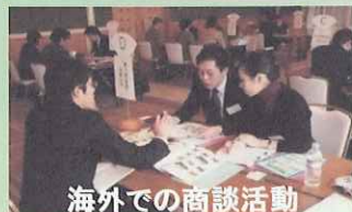
海外での商談活動