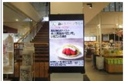
タブロイド誌「せとうちグルメ通信」（イメージ）